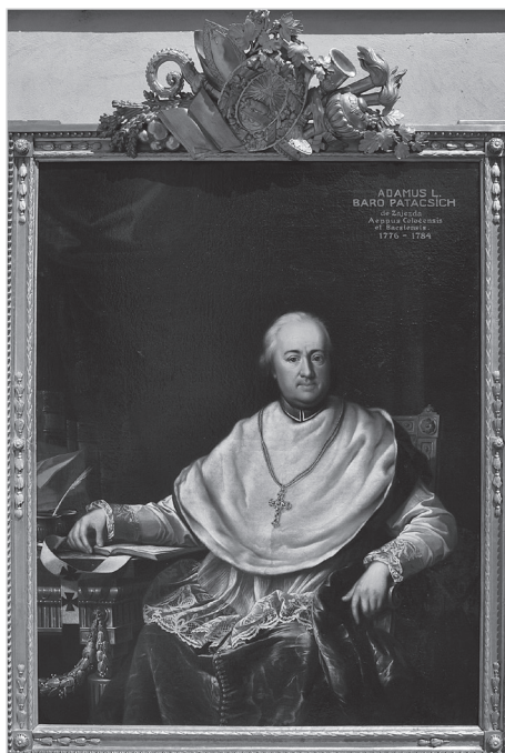
Patachich Ádám érsek. Olaj, vászon. Joseph Hickel, 1777.